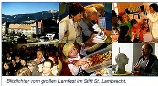
Blitzlichter vom großen Lernfest im Stift St. Lambrecht.

Das Bildungsnetzwerk legt auch sehr viel Wert auf das Setzen von Initiativen, die zum Lernen motivieren. So hat sich etwa, was im Jahr 2004 als Experiment begann, das Obersteirische Lernfest als beliebter und überaus erfolgreicher Publikumsmagnet bewährt.